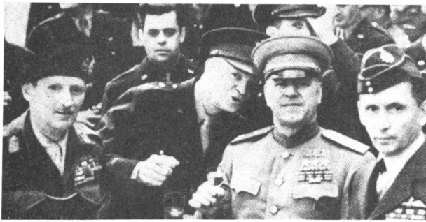
Einst in Berlin (1945): Die Marschälle Eisenhower und Schukow, Amerika und Rußland, friedlich vereint.