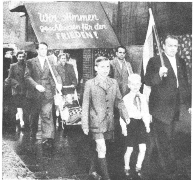
Heute in Ost-Berlin: Friedensdemonstration der Bevölkerung, aber ohne Eisenhower und Schukow.