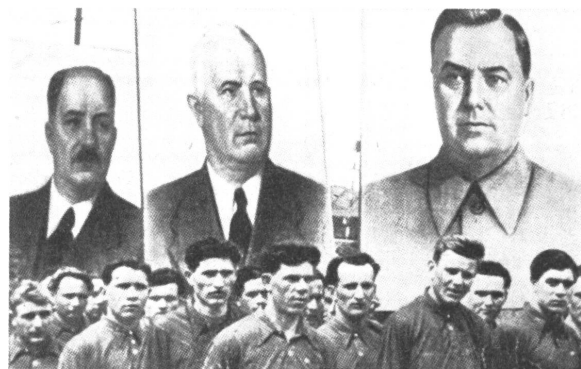
Arbeitermassen müssen hinter dem Eisernen Vorhang vor den Bildern Mikoyans, Chruschtschews und Malenkows verehrend vorbeiziehen, von denen der mittlere die beiden andern gestürzt hat.