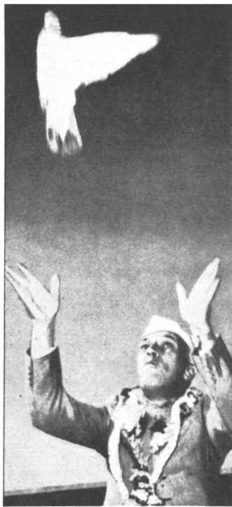
Nehru ließ an seinem Geburtstage Friedens-tauben flattern.