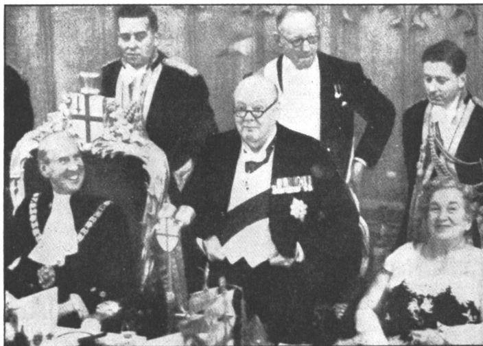
CHURCHILL: Es lohnt immer, für die Freiheit zu kämpfen.