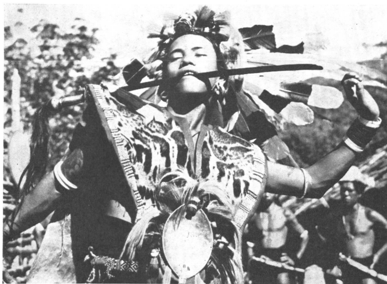
Neunjährige Tänzerinnen tanzen am Urwaldrand das Märchen der Prinzessin Rama beim Reiserntefest.