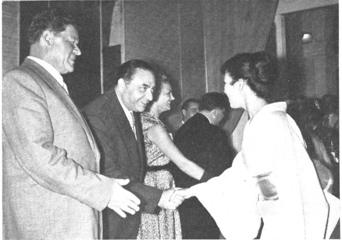
Das Lächeln des Ostens begegnet sich: Die russische Film-Delegation begrüßt an einem Empfang in Venedig die japanische.

Daß dies den Tatsachen sehr wohl entspricht, wissen wir alle aus Erfahrung. Jedoch müssen wir bedenken, daß der Film «On the Waterfront» dem tatsächlichen Milieu sehr nahekommt und daß daran, mei-