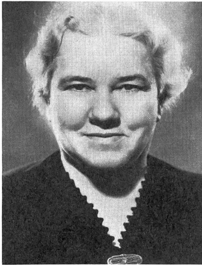
Schwester Kenny, die Millionen von Kindern Hilfe brachte.

AH. In Amerika will man das Leben von Schwester Kenny neu verfilmen. Wir kennen die Beweggründe zu diesem Entschluß nicht, begrüßen ihn jedoch von Herzen. Was diese Krankenschwester geleistet hat, scheint allerdings nicht sehr filmgeeignet: sie entdeckte eine Behandlungsmöglichkeit der Kinderlähmung, die Erfolge herbeiführte, konnte ihre Ansicht schließlich durchsetzen und zur Anerkennung bringen. Also ein geradliniges, glückliches Leben im Dienste bedauernswerter Kranker, besonders der Kinder.