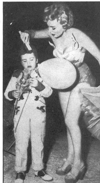
Die Filmschauspielerin Zsa Zsa Gabor bereitet ihr Töchterchen auf die Filmarbeit vor.

SCHWEIZERISCHER PROTESTANTISCHER FILM- UND RADIOVERBAND