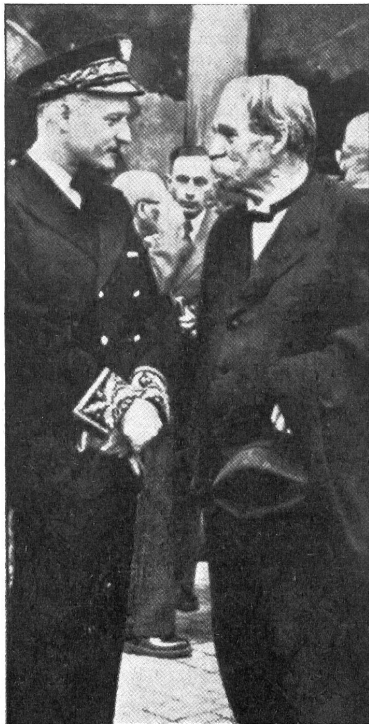
Prof. Albert Schweitzer, der den Schwarzen in Afrika durch seine Tätigkeit von Lambarene große Hilfe und Segen brachte, unterwegs zum Empfang des Nobelpreises nach Stockholm.