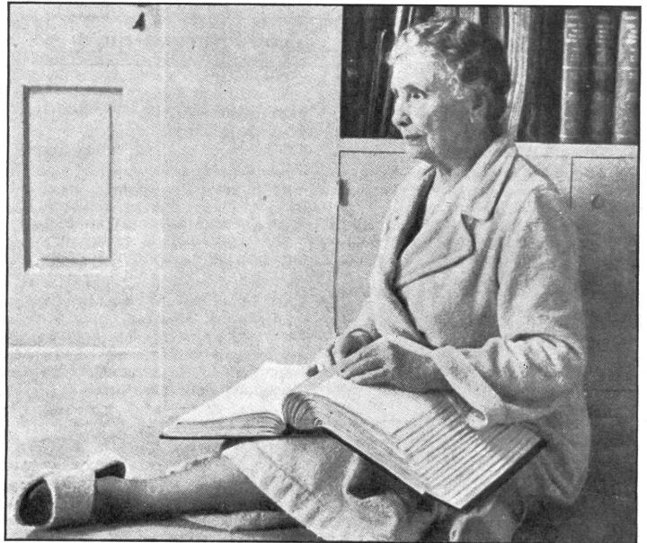
Rechts: Die 73jährige Helen Keller, von klein auf blind, taub und stumm, hat dank ihrer Beharrlichkeit und ihres Glaubens trotzdem das Leben gemeistert und wertvolle Bücher geschrieben. Ueber sie ist jetzt auch ein Film gedreht worden, «Die Unbesiegte».