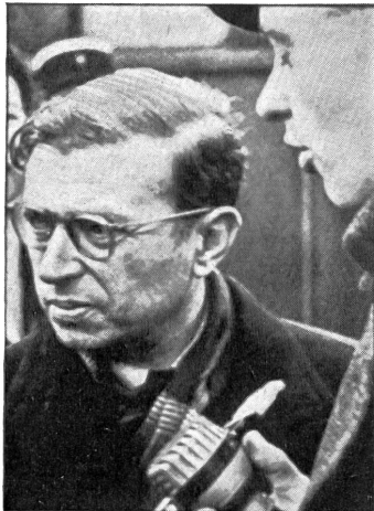
Links: J. P. Sartre, der Philosoph des glaubenslosen Boulevard-Existenzialismus ist nach 29 Tagen Aufenthalt in Moskau wieder in Paris eingetroffen und leistet den Kommunisten, die ihn einst als «typisches Produkt eines faulen Bürgertums» klassifiziert hatten, Propagandadienste am Mikrophon.