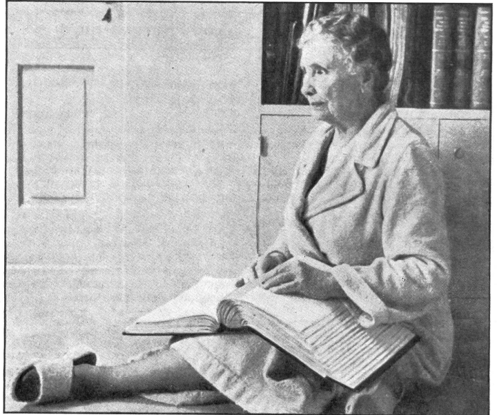
Rechts: Die 73jährige Helen Keller, von klein auf blind, taub und stumm, hat dank ihrer Beharrlichkeit und ihres Glaubens trotzdem das Leben gemeistert und wertvolle Bücher geschrieben. Ueber sie ist jetzt auch ein Film gedreht worden, «Die Unbesiegte».