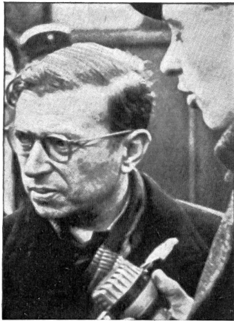
Links: J. P. Sartre, der Philosoph des glaubenslosen Boulevard-Existenzialismus ist nach 29 Tagen Aufenthalt in Moskau wieder in Paris eingetroffen und leistet den Kommunisten, die ihn einst als «typhisches Produkt eines faulen Bürgertums» klassifiziert hatten, Propagandadienste am Mikrophon.