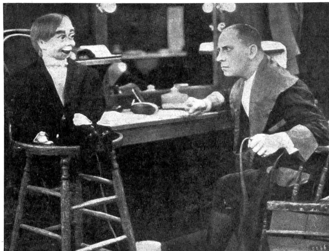
Erich von Stroheim in seinem ersten Tonfilm «The great Gabbo».

Er begab sich auch bald darauf dorthin und fand gelegentlich Arbeit als Extra für Massenszenen. Um diese Zeit begann der berühmte D. W. Griffith seinen Film «Birth of a nation». Stroheim wollte sich bei Griffith einführen lassen, was ihm nicht gelang, bis er auf einen wunderbaren Einfall kam. Jeden Morgen suchte er Griffiths Studios auf und sagte dem Direktionssekretär folgende unabänderliche Formel her: «Erich von Stroheim, Schauspieler, Drehbuchautor, Stunt-Mann, Extra- und Militär-Experte grüßt verbindlichst und wünscht zu wis-