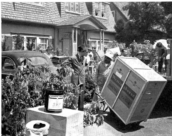
Der unglückliche Radio-Preisgewinner (James Stewart) inmitten eines Stroms von Waren, der sich über ihn ergießt.

ZS. Anspruchsloser, aber heiterer Sommerfilm, welcher vor allem die (bei uns glücklicherweise nicht vorhandene) Mode der Radio-Reklame-Wettbewerbe persifliert. Ein Angestellter eines Warenhauses möchte einmal etwas anderes tun, als immer bloß freundliche Gesichter gegenüber anmaßenden Kunden zu schneiden. Rascher als er denkt, sieht er sich in eine erfreuliche Lage versetzt, denn es gelingt ihm, eines jener unsinnigen Radio-Reklamepreisträgers von 24000 Dollar zu lösen, allerdings auf nicht ganz einwandfreien Wegen. Was das heißt, erfährt er bald, denn der Preis wird nicht in bar, sondern in Waren ausbezahlt, und wie: ein geschlachteter Ochse, die Jahresproduktion einer Suppenwürfelfabrik, gefrorenes Obst für drei Jahre, ein Flügel, ein Pony, das die Geranien frisst, ein mächtiges Schwimmbassin und dazu noch Menschen: ein Innenarchitekt, der die lieben,