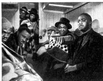
Der farbige Dorfpfarrer fährt auf der Suche nach seiner verkommenen Schwester und seinem verschwundenen Sohn in Johannesburg ein.