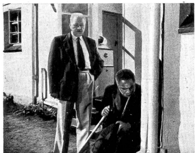
Er versucht, dem weißen Vater des Ermordeten zu sagen, daß sein Sohn der Täter ist. Später finden sich die beiden, indem der Weiße sich überwindet und ihm, der sein Amt verloren hat, großzügig hilft.

R ank, der englische Filmproduzent, hat einmal das Filmwesen mit einem Sumpf verglichen, dem man nicht mehr entkomme, sobald man die Füße nur ein wenig hineingesteckt habe. Aus religiösen Gründen habe er einst nebenbei kleine Filme herstellen wollen und sei eines Morgens als größter englischer Filmproduzent erwacht.