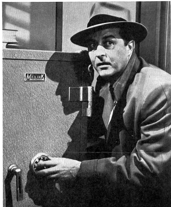
Der Held der Titelrolle (Ray Milland) am Tresor in dem formal außergewöhnlichen Film «The Thief».

Stummfilm? Keineswegs; die Umwelt, in der die Handlung abläuft, ist mit dem Gehör vernehmbar; also lediglich ein Film ohne Sprache. Es ist da der Lärm der Straßen, der Geräuschteppich eines Bahnhofs, das Fegen des Windes um die Terrasse des Wolkenkratzers, das Klingeln der Telephone, das Gezeter eines Grammophons. Diese Vielfalt der Geräusche des Alltags in den Straßen und in den Häusern der Großstadt schafft die hörbare Atmosphäre der Handlung, und das Ungeübte dieser atmosphärischen Gestaltung, die einem zum Bewußtsein kommen läßt, wie unergiebig und ungenau sonst meist der Tonfilm mit den Geräuschen arbeitet, wird zu einem Eindruck der Selbstverständlichkeit dadurch, daß die Geräuschwelt durchaus künstlerisch, das