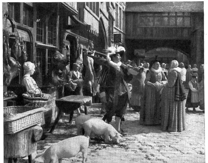
Bild aus dem Leben einer flämischen Stadt des 17. Jahrhunderts, eine Meisterleistung des Filmes «Kermesse héroïque».

Wenn der Film in die Geschichte eingegangen ist, so wegen der überlegenen Gestaltung dieses Stoffes. Es wird uns ein überschäumendes Bild des damaligen Lebens in Flandern gezeigt, in welchem Tod