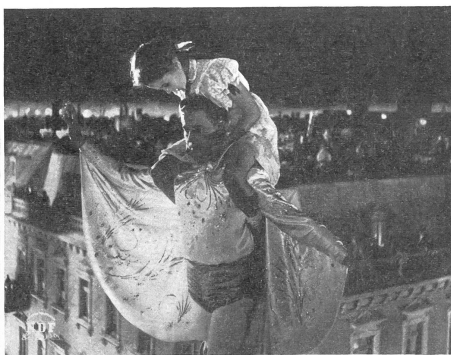
Die Angst des Menschenkinde auf dem hohen Seil (des Lebens): es blickt in die Tiefe und fürchtet sich, starr hinaufzusehen, wo die Verheissung schwebt, sich nicht zu fürchten.

Handlung ist hintergründig, tiefinnig, mit einer Ueberfülle aktueller Beziehungen. Es ist ein modernes Mysterienspiel von Rang, aber auch ein Verkündigungs-film, der uns alle angeht und ausgedehnten Stoff für Diskussionen bietet. — Wir weisen im übrigen auf unsere Kritik im «Dienst» Nr. 4 (April).