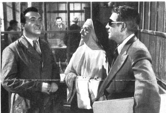
Es gelingt, ihm mit List ins Schulungszentrum für Blinde zu bringen, das ihm zum Sidhasal wird.

matie und List gibt er seine Zustimmung zum Eintritt in ein Schulungszentrum für Blinde, in dessen brüderlicher Atmosphäre er sich bald wohl fühlt. Dort fasst er auch eine Zuneigung zu einer blinden Lehrerin, deren sehender Bräutigam, Wirtschaftsleiter des Zentrums, ihm jedoch aus Eifersucht verrät, dass keine Hoffnung mehr für ihn bestehe, jemals geheilt zu werden. Der harte Schlag treibt ihn zum Selbstmordversuch, um dann jedoch endgültig die Lehrerin mit dem festen Willen an seine Seite zu bringen, ein gemeinsames Glück auch im Dunkel der Nacht aufzubauen. Die Kunst Jean Gabins in der Hauptrolle, von dem es einst hiess, er spiele in keinem Film, in welchem er nicht eine Ermordung darstellen könne, gibt dem Film eine männliche Beherrschtheit, und ver-