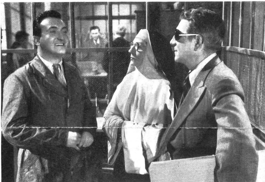
Es gelingt, ihm mit List ins Schulungszentrum für Blinde zu bringen, das ihm zum Sidisalt wird.

matie und List gibt er seine Zustimmung zum Eintritt in ein Schulungszentrum für Blinde, in dessen brüderlicher Atmosphäre er sich bald wohl fühlt. Dort fasst er auch eine Zuneigung zu einer blinden Lehrerin, deren sehender Bräutigam, Wirtschaftsleiter des Zentrums, ihm jedoch aus Eifersucht verrät, dass keine Hoffnung mehr für ihn bestehe, jemals geheilt zu werden. Der harte Schlag treibt ihn zum Selbstmordversuch, um dann jedoch endgültig die Lehrerin mit dem festen Willen an seine Seite zu bringen, ein gemeinsames Glück auch im Dunkel der Nacht aufzubauen. Die Kunst Jean Gabins in der Hauptrolle, von dem es einst hiess, er spiele in keinem Film, in welchem er nicht eine Ermordung darstellen könne, gibt dem Film eine männliche Beherrschtheit, und ver-