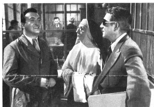
Es gelingt, ihm mit List ins Schulungszentrum für Blinde zu bringen, das ihm zum Sidisat wird.

matie und List gibt er seine Zustimmung zum Eintritt in ein Schulungszentrum für Blinde, in dessen brüderlicher Atmosphäre er sich bald wohl fühlt. Dort fasst er auch eine Zuneigung zu einer blinden Lehrerin, deren sehender Bräutigam, Wirtschaftsleiter des Zentrums, ihm jedoch aus Eifersucht verrät, dass keine Hoffnung mehr für ihn bestehe, jemals geheilt zu werden. Der harte Schlag treibt ihn zum Selbstmordversuch, um dann jedoch endgültig die Lehrerin mit dem festen Willen an seine Seite zu bringen, ein gemeinsames Glück auch im Dunkel der Nacht aufzubauen. Die Kunst Jean Gabins in der Hauptrolle, von dem es einst hiess, er spiele in keinem Film, in welchem er nicht eine Ermordung darstellen könne, gibt dem Film eine männliche Beherrschtheit, und ver-