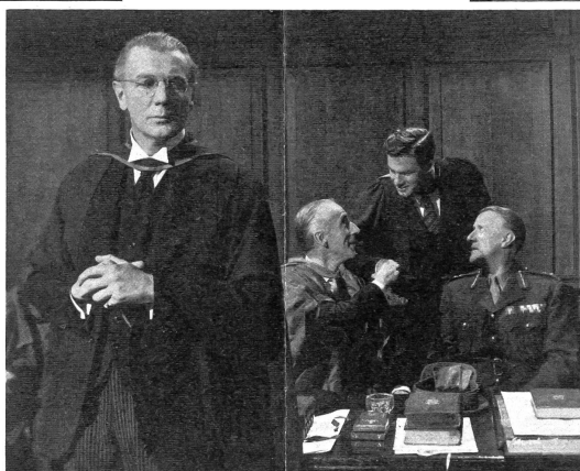
Bild Mitte: Er muss den Beifallsturm für die Abschieds worte eines jüngeren und beliebten Lehrers abwarten, bevor er mit einer ergreifenden Beichte beginnen kann. (Rank-Film)

«Browning version», der Uebersetzung eines griechischen Dramas. Das erschüttert und beglückt ihn, bis seine Frau das Geschenk in verletzender Weise herabzusetzen sucht. Ihr Liebhaber erkennt dabei ihren Charakter, und es gelingt ihm, sich mit dem Schwerebetroffenen auszureden und zu verständigen. In einer ergreifenden Abschiedsansprache vor der versammelten Schule findet dieser die Kraft, seine Fehler zu bekennen und zu bereuen. Dadurch steht er plötzlich allein, die ihm den Uebernamen «Himmel» gaben, menschlich nahe. Er hat gezeigt, dass er seine Schwachheit überwunden hat und ein neues Leben auf ihn wartet. Der Film versucht also eine innere Wandlung sichtbar zu machen, was ihm in fast vollkommener Weise gelingt. Der Lehrer hat sich aus seiner Verbittern gelöst, weil ihm ein unerwarteter Freundschafts- und Vertrauensbeweis geschenkt wurde, — wie wichtig kann es doch sein, einem geschlagenen Menschen etwas Zuneigung zukommen zu lassen! Das Geschehen spielt sich vor einem so realen Hintergrund ab, der dazu in seiner dokumentarischen Verhaltenseit so viel englisches Wesen zeigt, dass er die beiden offiziellen Auszeichnungen in Cannes wohl verdient hat. Hoffentlich folgt ihnen auch die Oeffentlichkeit.