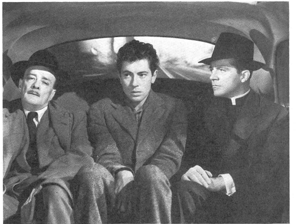
Bild rechts: Martin, der den Priester totgeschlagen hat, mit dem Polizeibeamten, der einen bestimmten Verdacht gegen ihn hegt, und dem jungen Nachfolger des Erschlagenen, der ihm zugetan ist und noch nichts ahnt. Ein symbolisches Bild: der verlassene, junge, schuldige Einzelmensch, eingekerkert zwischen den beiden grossen Kollektive Staat und Kirche.

Dieser amerikanische Film, über den wir heute eine Kritik veröffentlichten (siehe unten), verdient in mehr als einer Richtung unsere Beachtung. Es geht nicht nur um einen jungen, zerrissenen Mörder und seine Läuterung, sondern auch um die Frage der Entfremdung der Massen von den Kirchen. Es wird behauptet, dass wir daran alle mitschuldig seien, Pfarrer und Gemeindeglieder, dass die Menschen, unsere Nächsten, mitten in den Gemeinden vereinsamen, weil wir uns nicht persönlich um sie kümmern, nichts mehr von ihnen wissen und sie deshalb auch nicht mehr