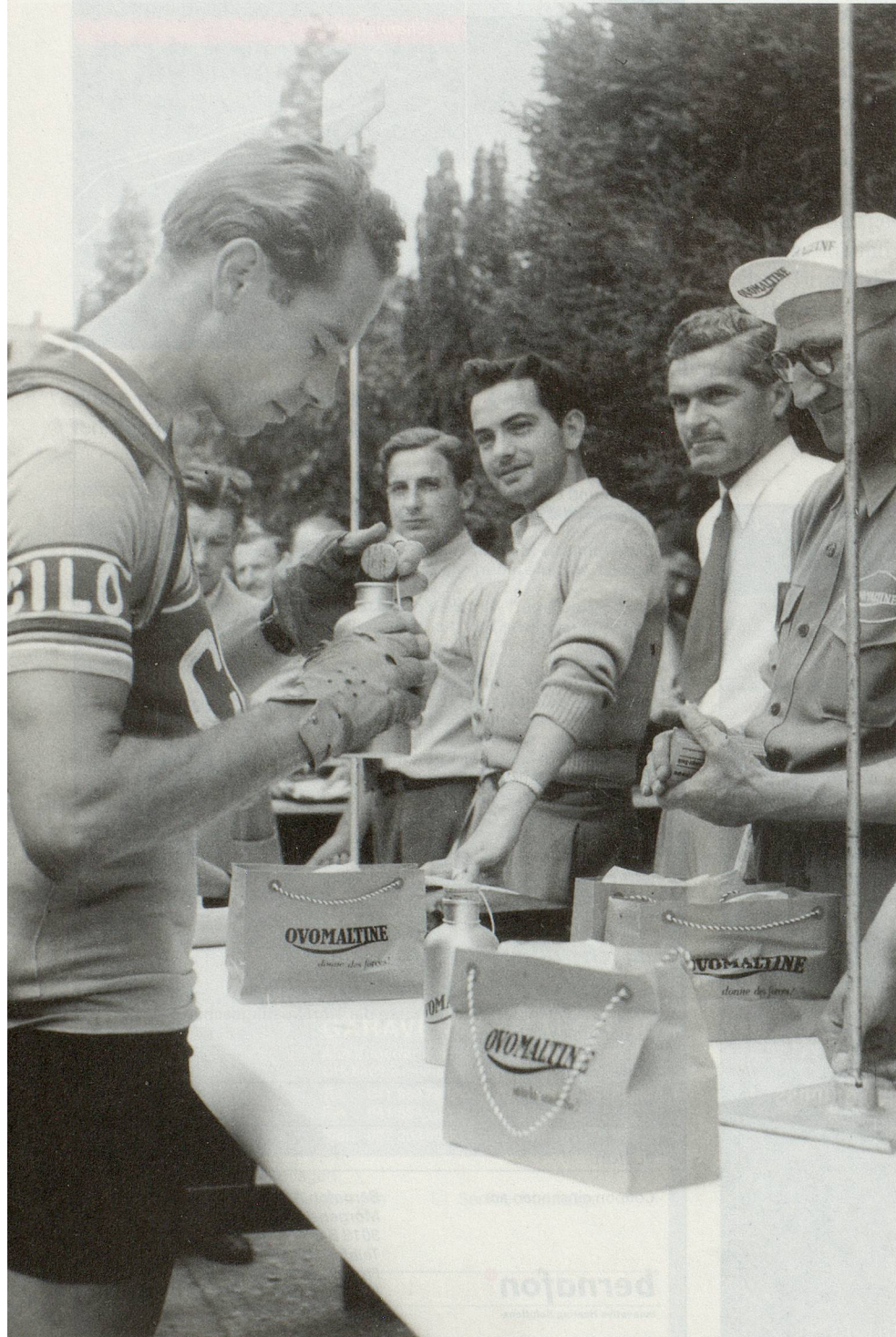
Kraft und Eleganz: Auch der «Pedaleur de charme» Hugo Koblet verliess sich auf Ovo.

Von Bern und später der Fabrik in Neueneegg BE aus setzte Ovomaltine oder «Ovaltine», wie sie auf Englisch heisst, zum Siegeszug rund um die Welt an. Schon 1913 entstand die erste Fabrik in England, es folgten Amerika, Asien und Ozeanien. Heute trinkt man in fast hundert Ländern der Erde Ovomaltine, von Australien bis Zimbabwe. Nach den Schweizern bringen es die Thailänder auf den zweithöchsten Ovo-Verbrauch pro