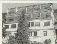
Hotel Les Orchidées 1854 Leysin

Rufen Sie uns an! Telefon 01 921 63 11, Fax 01 921 63 10 E-Mail: info@bibelheim.ch, Home-page: www.vch.ch/bibelheim