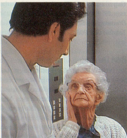
Christian Davis Begegnung der Kulturen in einem Schweizer Altersheim.

«ID SWISS» ist ein Schweizer Dokumentarfilm in sieben Episoden, der durch seine persönliche und subjektive Betrachtungsweise einer jüngeren Generation von Schweizer Filmemacherinnen und