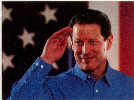
Vizepräsident Al Gore

W er sind die beiden möglichen Präsidenten der Vereinigten Staaten? Der 53-jährige Albert Gore versprach seinem Vater am Totenbett, er wolle Präsident werden. Der Vizepräsident während zwei Amtszeiten gilt als glaubwürdiger Familienmensch, als anständiger und nachdenklicher Mann der Mitte. Bei seinem Auftritt wirkt er eher farblos und hölzern. Gore wird dennoch Charisma und politisches Gespür nachgesagt, und sein Gedächtnis muss aussergewöhnlich sein. Er ist ein gefürchteter politischer Debattierer.