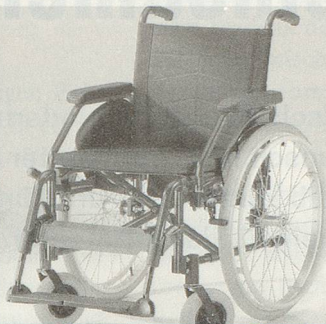
Rollstuhl Eurochair MEYRA

DER LEICHTE UND ZUKUNFTSWEISENDE ROLLSTUHL EUROCHAIR VON MEYRA