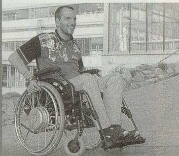
Elektro-Zusatzantrieb Servomatic MEYRA

DER ELEKTRO-ZUSATZANTRIEB SERVOMATIC VON MEYRA