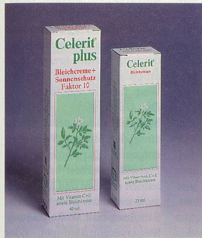
Schutz vor Pigmentflecken

Ihr gepflegtes und attraktives Aussehen ist Ihnen wichtig. Wären da nur nicht diese ärgerlichen Flecken auf Ihrer Haut. Grund genug, jetzt etwas gegen Pigmentflecken zu tun. Fragen Sie deshalb nach Celerit. Diese