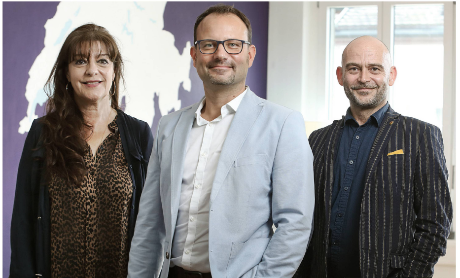
Drei lokale Makler der Immobilienagentur Neho.

Die Immobilienagentur automatisiert einen Grossteil wiederkehrender administrativer Aufgaben und verschafft den lokalen Maklern so mehr Zeit für die Betreuung ihrer Kunden. Dies vereinfacht den Verkaufsprozess und der