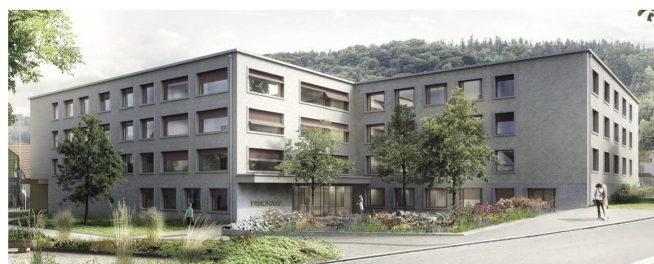
Neubau 2019: Patientenhaus «Panorama» in Littenheid

Beim Erkennen von psychischen Erkrankungen älterer Menschen und dem Weiterverweisen an Spezialisten spielt der Hausarzt eine wichtige Rolle. Er stellt fest, ob sich hinter körperlichen Symptomen eine psychische Erkrankung verstecken könnte und veranlasst im Bedarfsfall eine Überweisung an den passenden Spezialisten oder eine psychiatrische Klinik.