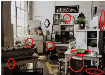
Auflösung aus Zeitlupe 2/20