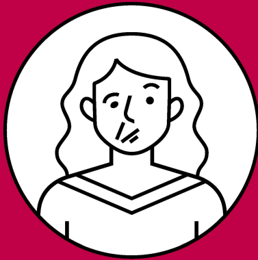
Lähmungen im Gesicht