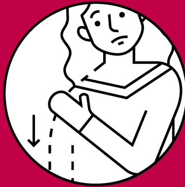
Lähmungen in den Armen oder Beinen