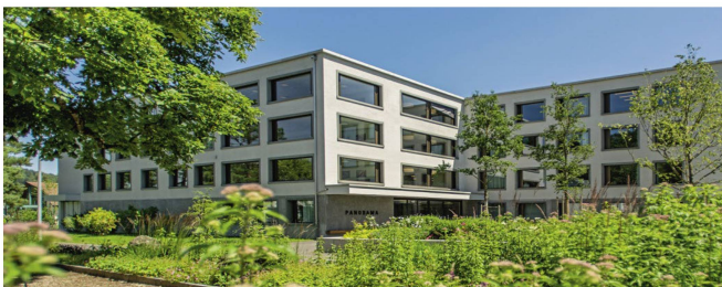
Neubau 2019: Patientenhaus «Panorama» in Littenheid

Fällt die Entscheidung zur Durchführung einer ambulanten oder stationären Psychotherapie, stehen im Umgang mit älteren Menschen die Vermittlung von Sicherheit und Stabilität, die Erarbeitung von individuellen Ressourcen und die Arbeit mit der persönlichen Lebensgeschichte im Fokus. Das Zentrum für Alter und Privé der Clenia Privatklinik Littenheid bietet die Möglichkeit einer spezifischen stationären Psychotherapie für Menschen in der zweiten Lebenshälfte. Dem Leistungsangebot für Zusatzversicherte wird mit modernen Einzelzimmern, erhöhter Einzeltherapiefrequenz, gehobenen Hotellerieleistungen und einem breit gefächerten Fachtherapieangebot Rechnung getragen.