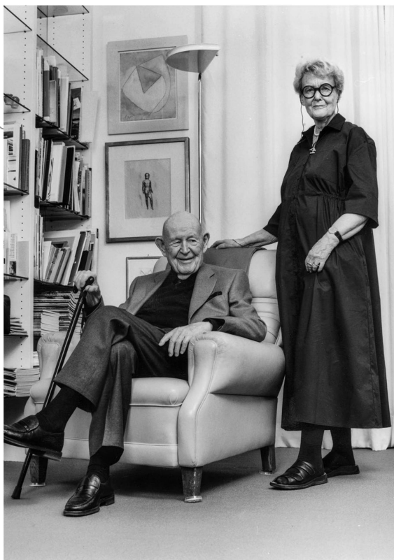
Trix und Robert Hassmann, Architektin und Gestalter

Lecture convaincante: Veza Urvölder