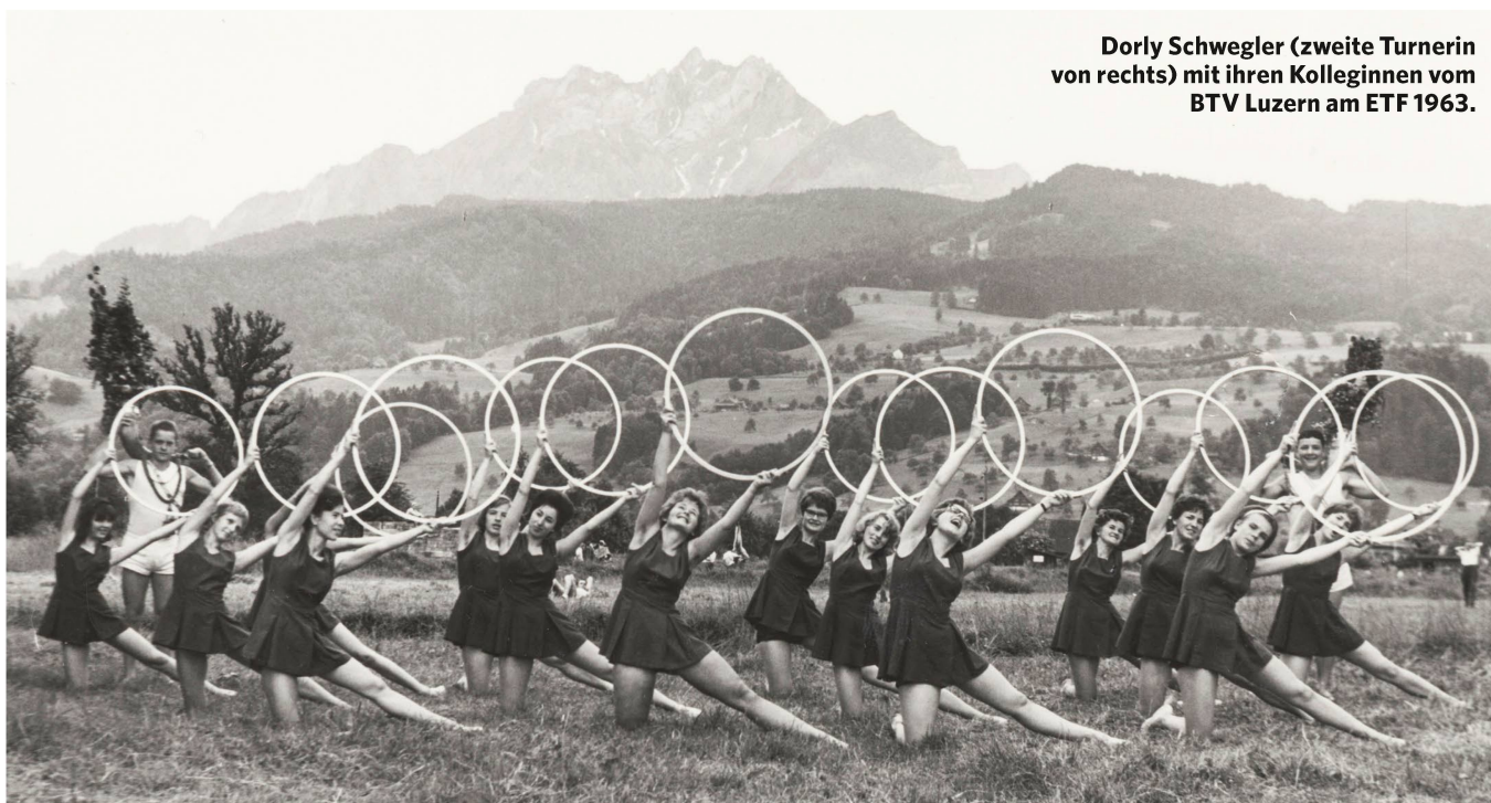
Dorly Schwegler (zweite Turnerin von rechts) mit ihren Kolleginnen vom BTV Luzern am ETF 1963.

Heute ist das ETF der grösste Sportanlass der Schweiz und findet alle sechs Jahre statt: 150 000 Besucherinnen und Besucher werden erwartet. Lange war es ein überschaubares Fest gewesen. Anfangs jährlich ausgetragen, dauerte es 42 Jahre, bis die Zahl der Teilnehmer die 1000er-Marke knackte. 1912 waren erstmals über 10 000 Sportler zugegen – und als Premiere durfte eine Gruppe Frauen teilnehmen, wenn auch nur für ein einstündiges Schauturnen. Es sollten 20 weitere Jahre vergehen, bis 1932 auch die weibliche Bevölkerung ihr eigenes nationales Turnfest hatte, wie im Buch «Die Eidgenössischen Turnfeste 1832–2002» zu lesen ist.