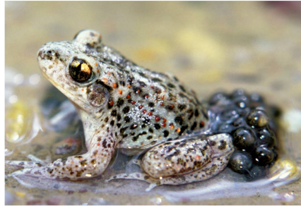
Das Glögglifrosch-Männchen trägt den Laich mit und bringt ihn später in ein geeignetes Gewässer.

Von da an sind die Quappen auf sich allein gestellt. Bis zur Umwandlung im Herbst oder im folgenden Jahr wachsen sie in ihrem Gewässer heran. Dieses kann ein Tümpel oder ein grösserer Teich oder gar eine ruhige Stelle in einem Fließgewässer sein. Es muss aber auch im Winter Wasser führen und frei von Beutegreifern wie Fischen bleiben, damit die Kaulquappen darin überleben können. Geburtshelferkröten haben relativ kleine Gelege, doch die anfängliche «Betreuung» verleiht den Nachkommen vergleichsweise gute Überlebenschancen. Zudem dauert die Fortpflan-