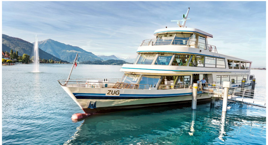
Mit der Lismete an Bord über den Zugersee kreuzen.

Am 24. April 2019 ist es so weit: Das erste Zeitlupe-Lismi-Schiff fährt um 15.15 Uhr ab Zug Bahnhofsteg (Anreise