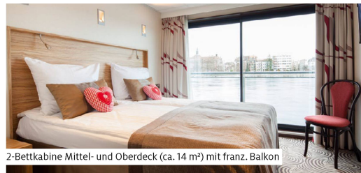
2-Bettkabine Mittel- und Oberdeck (ca. 14 m²) mit franz. Balkon