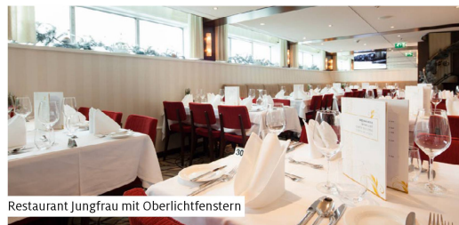
Restaurant Jungfrau mit Oberlichtfenstern