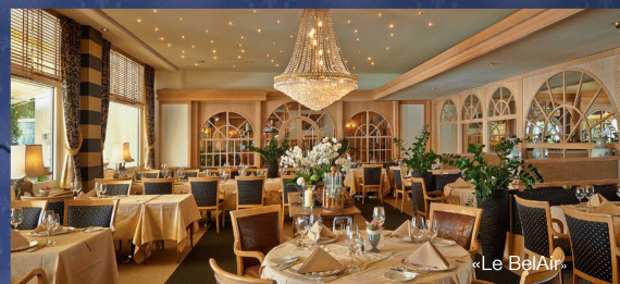
«Le Bel Air»

Das Arrangement speziell für Sie erfüllt Ihnen folgende Träume: