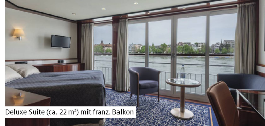
Deluxe Suite (ca. 22 m²) mit franz. Balkon