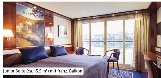
Junior Suite (ca. 15.5 m²) mit franz. Balkon