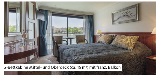
2-Bettkabine Mittel- und Oberdeck (ca. 15 m²) mit franz. Balkon