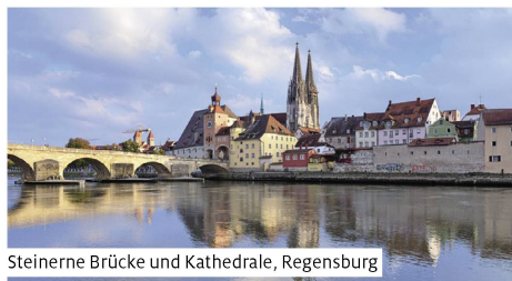
Steinerne Brücke und Kathedrale, Regensburg