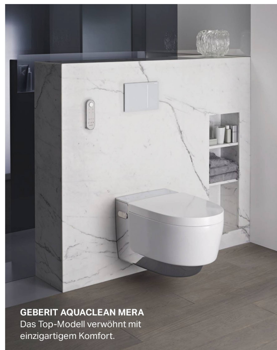
GEBERIT AQUACLEAN MERA Das Top-Modell verwöhnt mit einzigartigem Komfort.