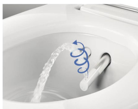
↑ Patentierter WhirlSpray Duschtechnologie