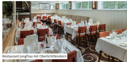
Restaurant Jungfrau mit Oberlichtfenstern