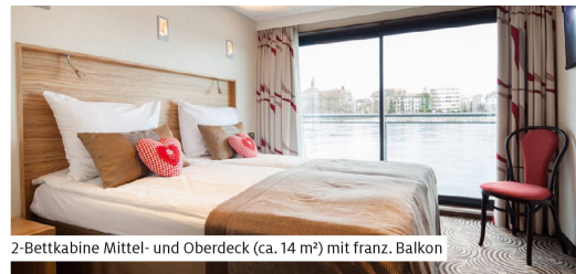
2-Bettkabine Mittel- und Oberdeck (ca. 14 m²) mit franz. Balkon