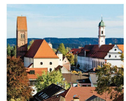
Oben: Ortsbild Bad Wörishofen Links: Aromagarten Bad Wörishofen