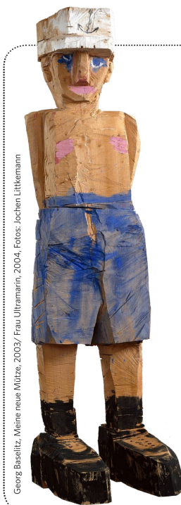
Georg Baselitz, Meine neue Mütze, 2003/ Frau Ultramarin, 2004