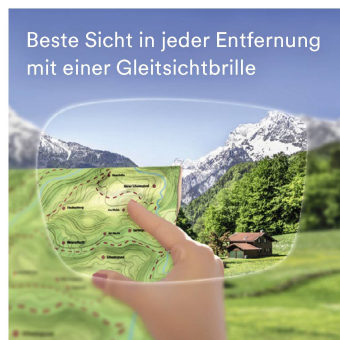
Beste Sicht in jeder Entfernung mit einer Gleitsichtbrille

Immer beliebter werden daher Brillen mit Gleitsichtgläsern. So erspart man sich den ständigen Wechsel zur Lesebrille und hat immer eine optimale Sicht in die Nähe, Zwischendistanz und in die Ferne.