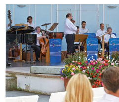
Oben: Das Kurorchester in Aktion Links: Der Rosengarten in voller Pracht