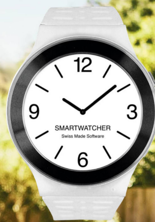
SENSE CHF 349.-