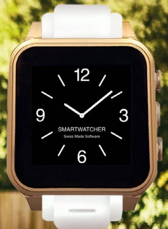
CHRONO CHF 499.-