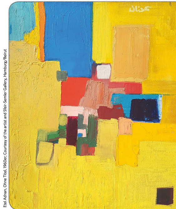
Etel Adnan, Ohne Titel, 1960er, Courtesy of the artist and Steirersee Gallery, Hamburg/Beirut