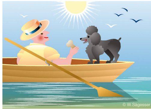
Auflösung aus Zeitlupe 6/18