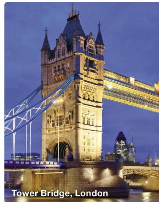
Tower Bridge, London

10. Tag: London – Zürich Gegen Mittag erfolgt Ihr Transfer zum Flughafen. Rückflug nach Zürich.