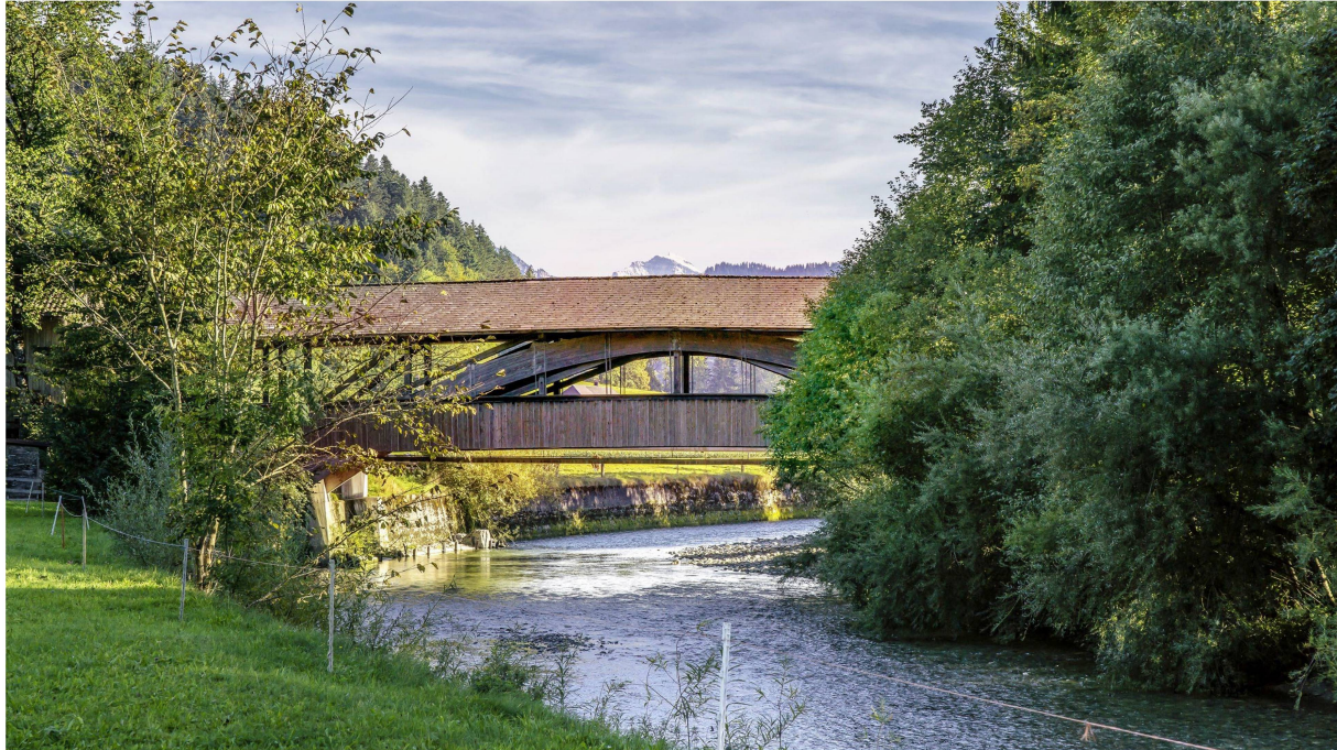
Die Dieboldswilerbrücke ist für Autos gesperrt (links). Beeindruckendes Ständerfachwerk der Aeschaubrücke.