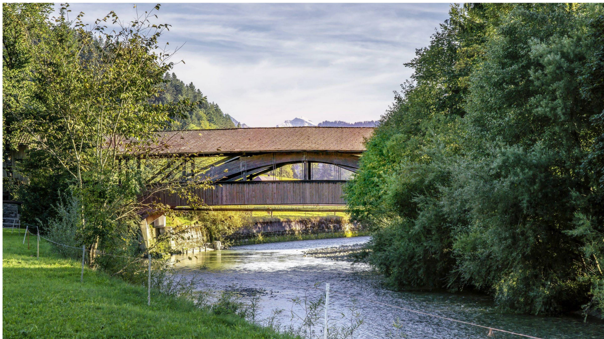
Die Dieboldswilerbrücke ist für Autos gesperrt (links). Beeindruckendes Ständerfachwerk der Aeschaubrücke.